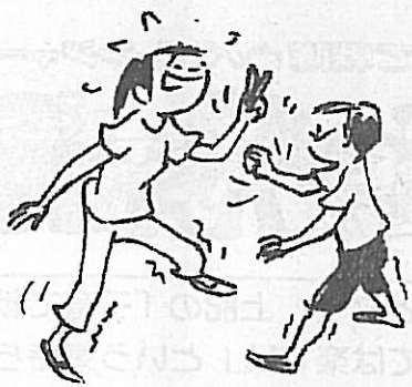
じゃんけん足開き