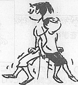
背中合わせ立ちすわり