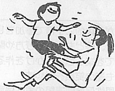
ひざ立ちバランス